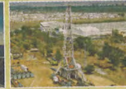
तेल एवं गैस