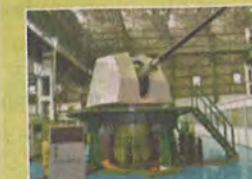
रक्षा और अंतरिक्ष