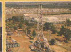
OIL & GAS