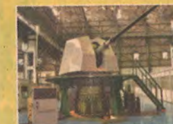
DEFENCE & AEROSPACE